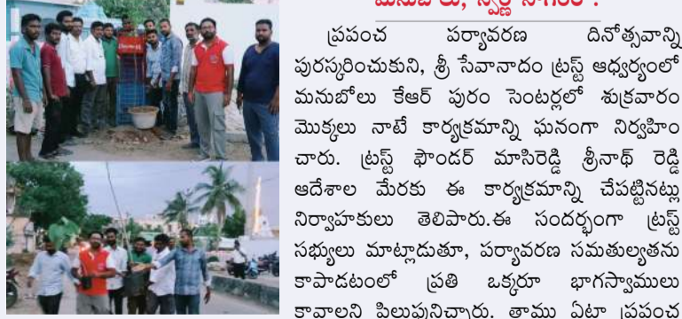
మనుబోలు, స్వర్ణ సాగరం :

శ్రీ సేవానాదం ట్రస్ట్ ఆధ్వర్యంలో మొక్కలు నాటి కార్యక్రమం