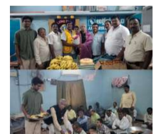
రేణిగుంట స్వర్ణ సాగరం జూన్ 05

శుభాకాంక్షలు తెలిపిన లయన్స్ క్లబ్ సభ్యులు