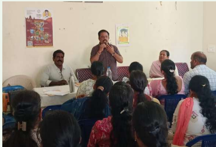
స్వర్ణ సాగరం ఎర్వేడు: