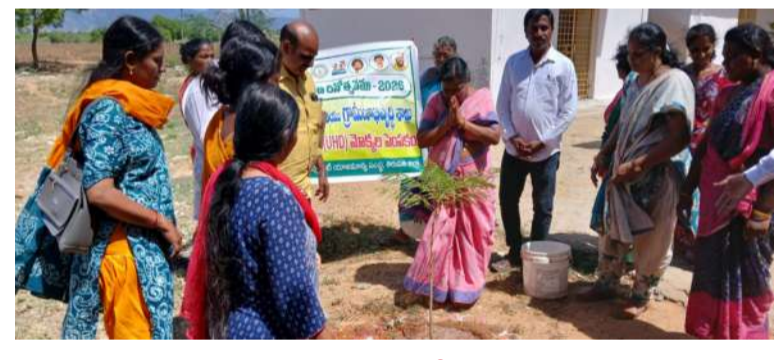
స్వర్ణ సాగరం ఏర్వేడు :

ఏర్వేడు మండలం పల్లం గ్రామ పంచాయతీ పరిధిలోని జెడ్పీ హైస్కూల్లో గురువారం ప్రపంచ పర్యావరణ దినోత్సవ వేడుకలు ఘనంగా నిర్వహించారు. పర్యావరణ పరిరక్షణపై అవగాహన కల్పించేందుకు ప్రత్యేక కార్యక్రమాన్ని ఏర్పాటు చేశారు. ఈ కార్యక్రమంలో ఏపీడీ, ఎంపీడీవో, ఏపీఓ, కనీ, టీపీ, ఎఫ్ఐపీ తదితర అధికారులు పాల్గొన్నారు. నెట్ జోల్ హెల్డ్ క్యాంపస్ సిబ్బంది జిల్లా, జిల్లా ఆర్డీనెట్ల రాజు ఆధ్వర్యంలో హాజరయ్యారు. వారితో పాటు నలుగురు సభ్యులు, వాలంటీర్లు, ఉపాధి హామీ కులీలు, పీడీఓ, గ్రామ పంచాయతీ సిబ్బంది కూడా పాల్గొన్నారు. ఈ సందర్భంగా పర్యావరణ పరిరక్షణ అవసరాన్ని అధికారులు వివరించారు. వాతావరణ మార్పులు, కాలమ్మెల వల్ల కలుగుతున్న దుష్పరిణామాలపై అవగాహన కల్పించారు. ప్రతి ఒక్కరూ మొక్కలు నాటి వాటిని సంరక్షించాలని సూచించారు. ప్లాస్టిక్ వినియోగాన్ని తగ్గించి పరిశుభ్రమైన పరిసరాలను కాపాడాలని పిలుపునిచ్చారు. పచ్చదనం పెంపొందించేందుకు ప్రజలందరూ భాగస్వాములు కావాలని కోరారు. విద్యార్థులు, గ్రామస్థులు పర్యావరణ పరిరక్షణకు కృషి చేయాలని ప్రతిజ్ఞ చేశారు. కార్యక్రమంలో పాల్గొన్న అధికారులు, సిబ్బంది పర్యావరణ పరిరక్షణకు తమ వంతు సహకారం అందిస్తామని తెలిపారు. కార్యక్రమం ఉత్సాహభరిత వాతావరణంలో విజయవంతంగా ముగిసింది