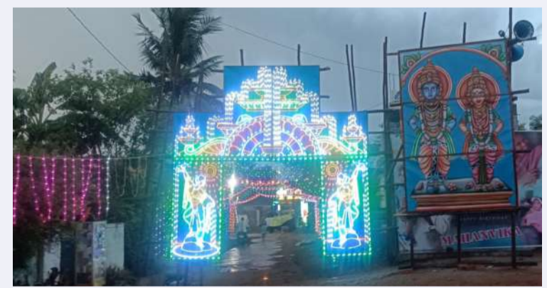
చెట్లకూరు, స్వర్ణ సాగరం జూన్ 5.

మండలంలోని చెంబేడు గ్రామం నందు శనివారం శ్రీరుక్మిణి సమేత శ్రీ పాండురంగస్వామి 17వ అనంద అగ్నిగుండ మహోత్సవ వేడుకలు అంగరంగ వైభవంగా నిర్వహించనున్నట్లు భజన భక్త బృందం తెలియచేసారు. అగ్నిగుండ వేడుకలు సందర్భంగా గ్రామంను విద్యుత్ దీపాలు అలంకరించి ధ్వజస్తంభంను అంగరంగ వైభవంగా అలంకరణ చేశారు. శనివారం రాత్రి జరగనున్న పాండురంగ భజనో భాగంగా ప్రారంభ గీతములు, కృష్ణ లీలలు, కోలాటం, పాండురంగస్వామి దండకం, నలసింహస్వామి దండకం మొదలగు భజనలు నేడు చెంబేడు గ్రామం నందు పలువురిని ఆకట్టుకున్నాయి. శుక్రవారం సముద్ర స్నానం ఆచరించిన భజన బృందం నేడు 9స్నానాలు ఆచరించి సాయంత్రం కలిశ పూజ అనంతరం భక్తులు కంకణం కట్టుకొని అగ్నిగుండంలో ప్రవేశించనున్నారు. భక్తులు ఆదిక సంఖ్యలో పాల్గొని పాండురంగ స్వామి కృపా కటాక్షములు పొందుకోవాలని భజన బృందం తెలిపారు.