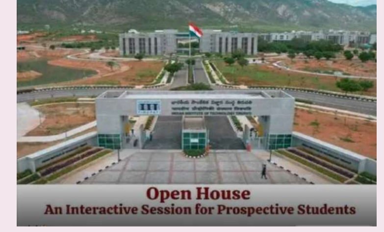
Open House An Interactive Session for Prospective Students