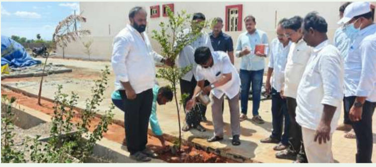
కనిగిరి స్వర్ణ సాగరం జూన్ 05

ఎమ్మెల్యే డాక్టర్ ముక్కు ఉగ్ర నరసింహ రెడ్డి