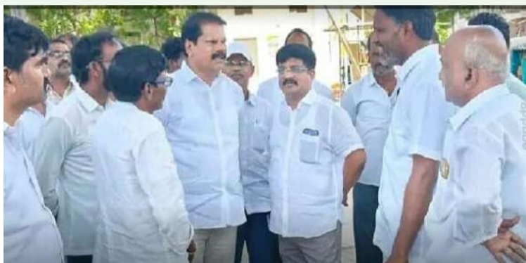
కనిగిరి స్వర్ణ సాగరం జూన్ 5

కనిగిరిలో అంబేద్కర్ కాంస్య విగ్రహ ఆవిష్కరణ మహోత్సవ కార్యక్రమానికి ఏర్పాట్లను శుక్రవారం ఎమ్మెల్యే డాక్టర్ ముక్కు ఉగ్ర నరసింహ రెడ్డి మరియు ఎన్డీఎంపీలతో కలిసి ఇన్చార్జ్ గూడూరి ఎరిక్స్ బాబుతో కలిసి పర్యవేక్షించారు. ఈ కార్యక్రమాన్ని విజయవంతంగా నిర్వహించేందుకు అవసరమైన అన్ని ఏర్పాట్లపై అధికారులతో ఆయన సమీక్ష నిర్వహించారు.