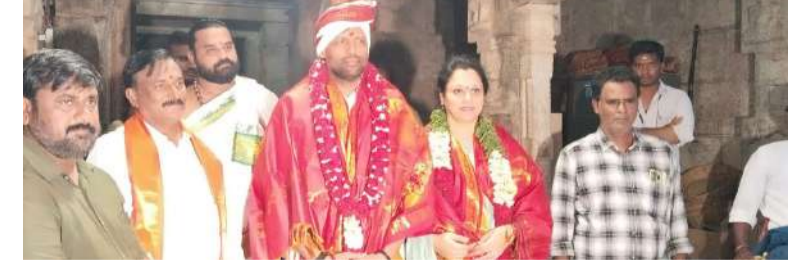
స్వర్ణ సాగరం ఏర్వేడు :