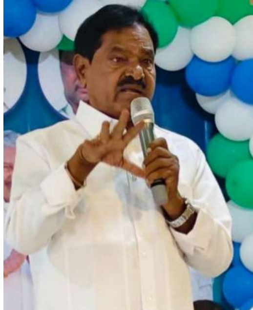
మాజీ డిప్యూటీ సీఎం మాట్లాడుతూ రైతులు అవస్థలు పడుతున్న మామిడి రైతులు ప్రభుత్వానికి కనపడలేదా..మామిడి రైతులు అంటే ఎందుకు అంత