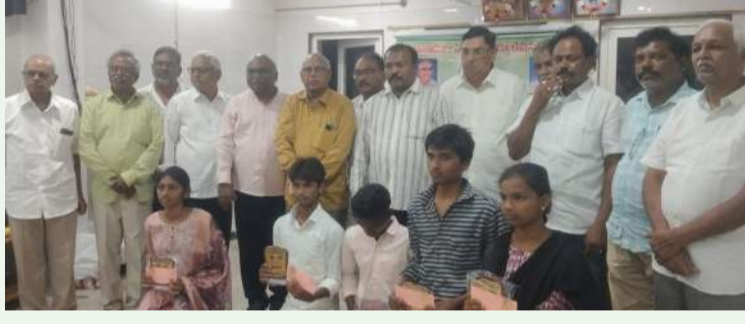
నెల్లూరు స్వర్ణ సాగరం జూన్ 8

యానాదుల హెల్త్ అండ్ ఎడ్యుకేషన్ సొసైటీ తోడ్పాటు