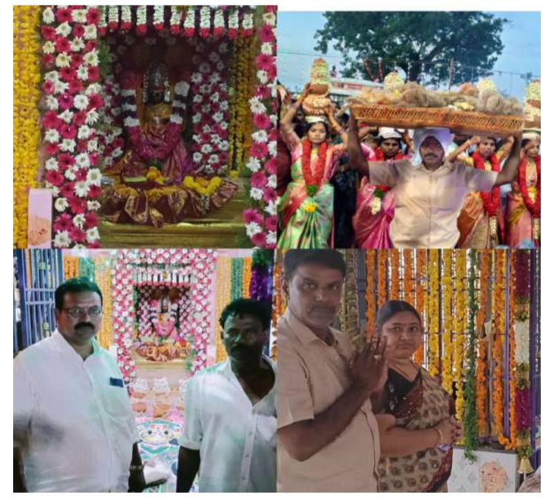
మనుబోలు, స్వర్ణ సాగరం:

దుష్టశక్తుల నుంచి గ్రామాన్ని కాపాడుతూ, తమను కంటికి రెప్పలా కాపాడే మనుబోలు మండలంలోని గురువీంద పూడి గ్రామ దేవత శ్రీశ్రీశ్రీ ఓసూరమ్మ తల్లి వార్షిక ఉత్సవాలు ఆదివారం రాత్రి అత్యంత భవ్యంగా ప్రారంభమయ్యాయి. అమ్మవారి ఆశీస్సుల కోసం స్థానికలతో పాటు రాష్ట్రవ్యాప్తంగా వివిధ ప్రాంతాల నుంచి భక్తులు భారీగా తరలివచ్చారు.