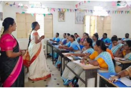
బరాల ప్రాజెక్టు సిడిపిఓ నిర్వహణ