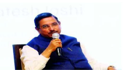
కూడా పెరిగాయి. కాబట్టి సామాన్యుల గురించి మాకు ఆందోళన ఉంది. కానీ అదే సమయంలో గ్యాస్ ధరల పెంపు అనివార్యంగా మారింది. "

"గ్యాస్ సిలిండర్ ధరల పెంపు పట్ల మేము కూడా చాలా భాధపడుతున్నాం, విచారం వ్యక్తం చేస్తున్నాం. కానీ మమ్మల్ని విమర్శించే ముందు ప్రతి ఒక్కరూ ప్రపంచవ్యాప్త పరిస్థితులను అర్థం చేసుకోవాలి. ప్రపంచం తీవ్రమైన సంక్షోభాల మధ్య సతమతమవుతోంది. రవాణా సజావుగా సాగకపోవడం, చాలా పరిమిత వనరుల నుంచే ఎల్పీజీ లభించడం వంటి సమస్యలు ఉన్నాయి. ఎల్పీజీ, పెట్రోల్/డీజిల్ వినియోగదారులకు ఎటువంటి ఇబ్బంది కలగకుండా చూసేందుకు ప్రధాని నరేంద్ర మోదీ నేతృత్వంలోని భారత ప్రభుత్వం సేకరణ వనరులను పెంచడానికి ప్రయత్నిస్తోంది. భారత్ కు చాలా దూరంలో ఉన్న దేశాల నుంచి కూడా గ్యాస్, ఇంధన సేకరణ జరుగుతోంది. రవాణా ఖర్చులు ఎక్కువగా ఉన్నాయి. మూల ధర కూడా అధికంగా ఉంది. అలాగే 40-45 రోజుల రవాణా సమయం కారణంగా బీమా ఖర్చులు